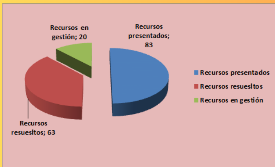
Gráfico 3. Tasa de gestión de recursos